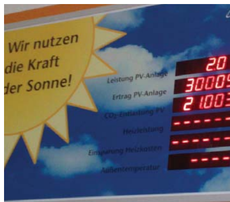
På passivhus-skolen Riedberg kan elvene orientere seg om el-produksjonen fra solcellepanelene.